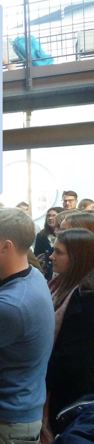
Großes Bild: Besichtigung „Therme 1“